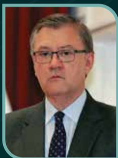
Alfonso Grados Carraro

Ministro de Trabajo y Promoción del Empleo