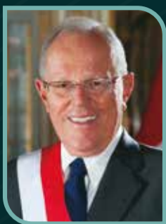
Sr. Pedro Pablo Kuczynski

Presidente Constitucional de la República del Perú