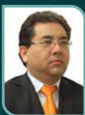
Nelson Shack Yalta

Contralor General de la República del Perú