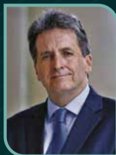
Pablo de la Flor

Ministro de Trabajo y Promoción del Empleo